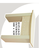
2... BANCHI 1100 x 560 x 900 mm. STRUTTURA STUCCO Bianco