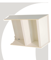
2... ESPOSITORI 835 x 330 x 1160 mm.