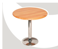
1... TAVOLO Ø 800 mm.