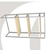
2... SCAFFALI 800 x 300 x 1500 mm.