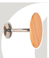
2... TAVOLI Ø 800 mm.