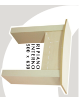
2... BANCHI 1100 x 560 x 900 mm. STRUTTURA COLOR BIANCO