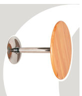
2... TAVOLI Ø 800 mm.